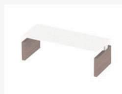
Scenarios met melamine wangen