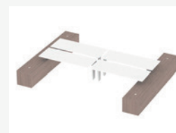
Scenarios met melamine cabinets